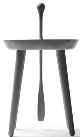
①NT (エヌティー) (株)アルフレックスジャパン/1976 積層成型合板のフレームに、背座面は革または布テープの編み込み。シンプルで軽やかな小椅子は身体になじみやすい。 ②「鶴見つばさ橋」/1994 橋長1kmの1面吊り3径間連続鋼斜張橋。ゲートのシンボル性と人に対する視覚的安らぎを考慮した、遠近の調和とスレンダーで力強いフォルム。 ③QUODO・LUX「クオド ラックス」 (株)カンディハウス/2004 「日本の上質、品格」をテーマに作り込んだソファ。昨年、自由な組み合わせができるシステムソファ「クオド」へと進化している。 ④STEP STEP (Stool and Shoehorn) 日進木工(株)/2008 靴べらと合体したスツール。上り框の低い女関で愛用している。差し込んで揺れる姿が、「イッテラッシャイ」と手を振るよう。